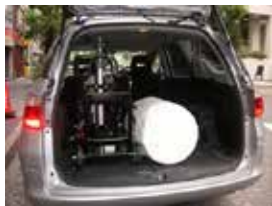
ライトバンで運搬可能