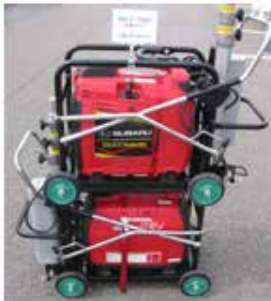
積み重ねが可能です