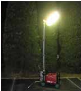
可変ネック角度変更