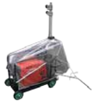
防雨シートカバー