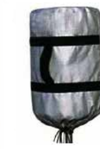
投光部収納袋が標準装備