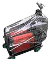
保管カバー兼用 (オプション品)